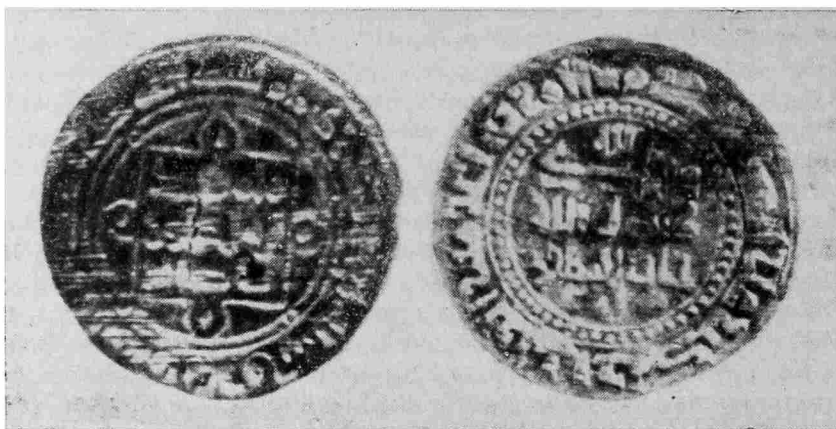
Рис. 1. Фельс Илака 391 года хиджры. Аверс и Реверс

ремесленник-портной назван дихканом, и сообщение О. И. Сухаревой о том, что в Бухаре в начале XX в. дихканами все еще называли горожан, имевших загородные участки 29 . Так выглядит вопрос об исторических судьбах дихканства, для решения которого до сих пор привлекали лишь данные средневековых письменных источников и памятников эпиграфического характера. Нумизматические данные, сколько нам известно, к решению или уточнению этого вопроса до сих пор не привлекались ни разу. А между тем данные караханидской нумизматики сообщают очень интересные сведения для освещения одного из аспектов этой проблемы.